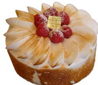
Meringue frambose/lemon taart